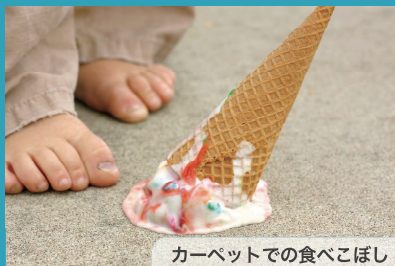
カーペットでの食べこぼし