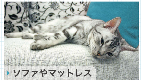
▶ ソファやマットレス

※ 掃除機の種類によってはホースが接続できない場合があります ※ じゅうたんの種類によっては、じゅうたんの裏側まで水が浸透することがあります ※ 油污れ、着色性の強いもの(リコピン、ポリフェノール、ターメリックなど)は落ちにくい場合があります