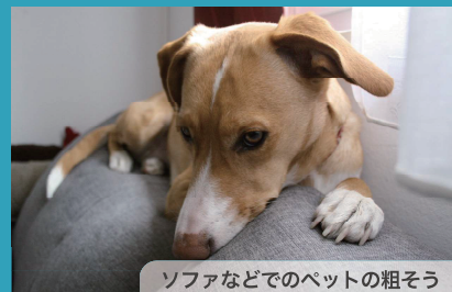
ソファなどでのペットの粗そう