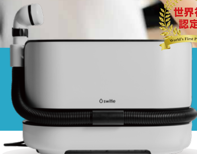
オールインワン介護用洗身用具